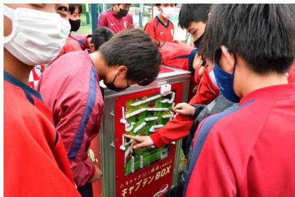
キャプテンBOXを楽しむアカデミー生

東洋製罐グループは、株式会社鹿島アントラーズ・エフ・シー（以下、鹿島アントラーズ）の下部組織が活動するつくばアカデミーセンター（アカデミー専用サッカーグラウンド）にエコステーション（資源回収ステーション）「E-DOME」を設置いたしました。「E-DOME」内には、仕掛けの一つとして、大人から子供まで楽しくペットボトルのキャップ回収ができる専用回収機「キャプテンBOX」を設置し、資源循環の実証実験を行います。