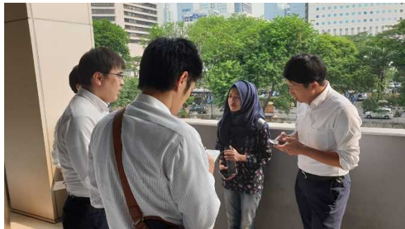
2019年インドネシア訪問の様子