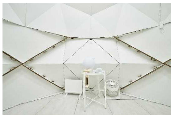
《プロダクトイメージ》