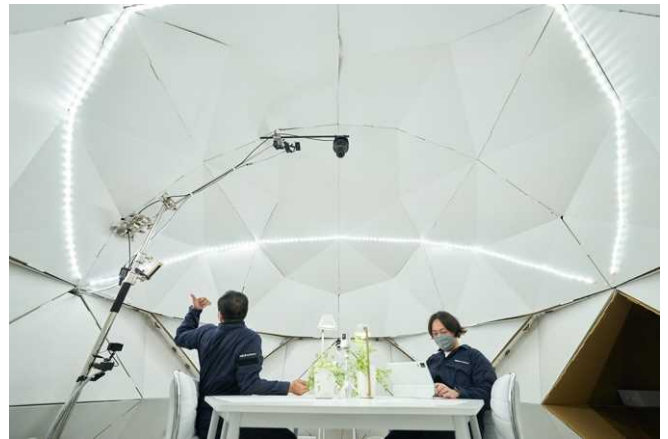
《プロダクト内装イメージ》