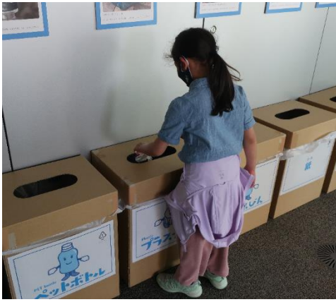
(リサイクル可能な「容器ごみ」が入場料です。参加者がその場で分別します)