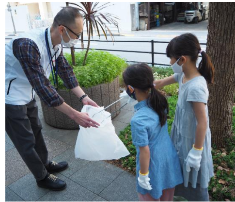
(会場の外では、目黒川沿いのごみ拾いを行いました)