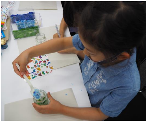
(回収されたびんがアップサイクルされ、アート素材「ループース」へと生まれ変わりました)