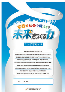
ワークブック(6ページ)